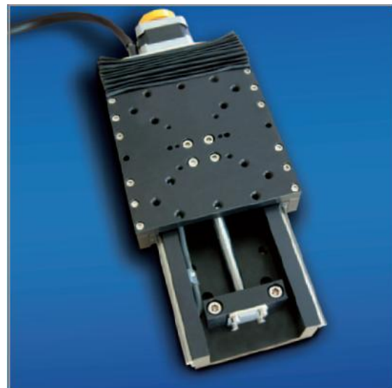
Motorisierte Präzisions-Positionierachse – Rollon GmbH, Ratingen