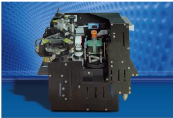
Decappersystem – ATS Automation Tooling Inc., Cambridge, Kanada