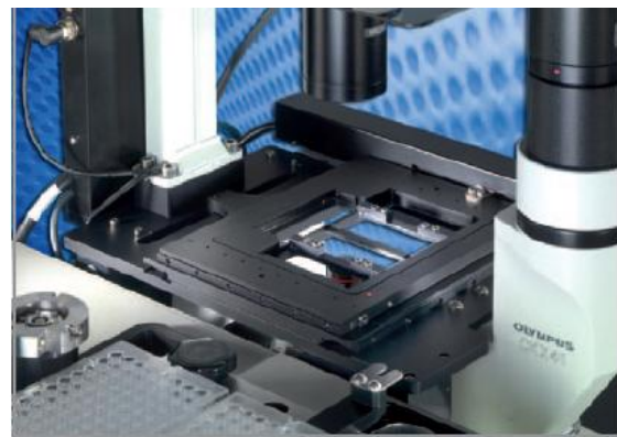
Kreuztisch – ALS GmbH, Jena

ALS entwickelt individuelle Lösungen für Ihre spezifischen Anwendungen und Vorhaben.