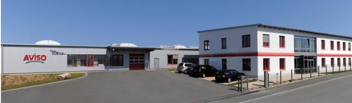
ALS Firmensitz in Jena

Die ALS Automated Lab Solutions GmbH ist ein Hersteller innovativer Systeme, mit denen neue Methoden in der Stammzell- und Krebsforschung sowie in der Antikörperproduktion entwickelt werden. Diese hohen Anforderungen an unsere technologischen Entwicklungen sind nur mit einem Höchstmaß an Präzision und Qualität zu erfüllen. Deshalb pflegt ALS den internationalen Erfahrungsaustausch mit renommierten Persönlichkeiten der Biowissenschaften. Die Arbeit an Stammzellen, die Erkenntnis von grundlegenden Prozessen der Umprogrammierung von Zellen und das Verständnis, wie sich Gewebe und ganze Organe entwickeln, werden die Medizin der nahen Zukunft entscheidend verändern. Um diesen Ansprüchen gerecht zu werden, benötigt die regenerative Medizin standardisierte Prozeduren, damit Therapien sicher und effektiv gestaltet werden können. Für unsere Kunden aus den Bereichen Analytik, Pharmazie, Biotechnologie und Medizintechnik ist ALS nicht nur ein erfahrener Partner für Wissenschaft und Forschung, sondern auch der Spezialist für die Entwicklung und Fertigung technologischer Gerätesysteme und Baugruppen. Absolute Transparenz und bestmöglicher Service im Umgang mit diesen sensiblen Systemen bilden auch die Basis für eine weltweit erfolgreiche OEM-Kooperation.