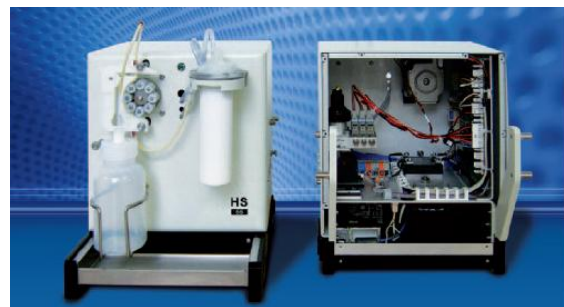
HS 55 – Analytik Jena AG, Jena