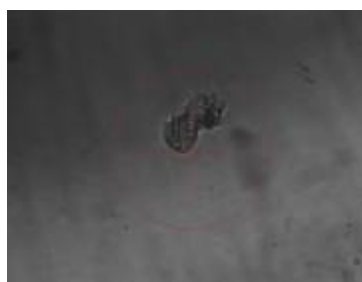
Gewebeverband in der Zielplatte